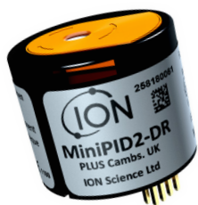
Sensore minipid 2